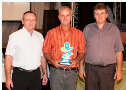
Núcleo Vencedor – linha Rincão Fundo, Panambi