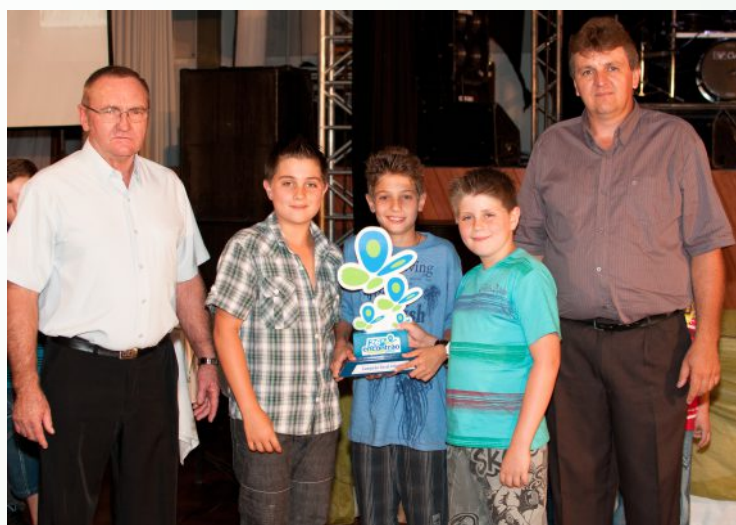
1º lugar – Núcleo Unidos do Campo – linha Maraney, Panambi