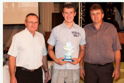
Núcleo Força da Terra – linha 29, Ajuricaba