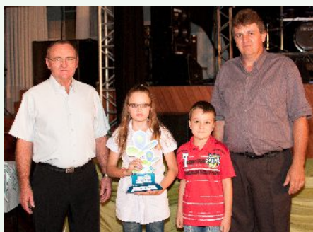
Núcleo Vencedor – linha Rincão Fundo, Panambi