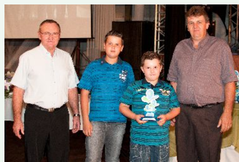
Núcleo Sempre Avante – linha Ocearú, Panambi