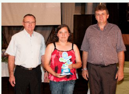
Núcleo Amigos da Terra – linha Pontãozinho, Condor