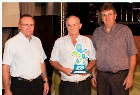
Núcleo Unidos do Campo – linha Maraney, Panambi