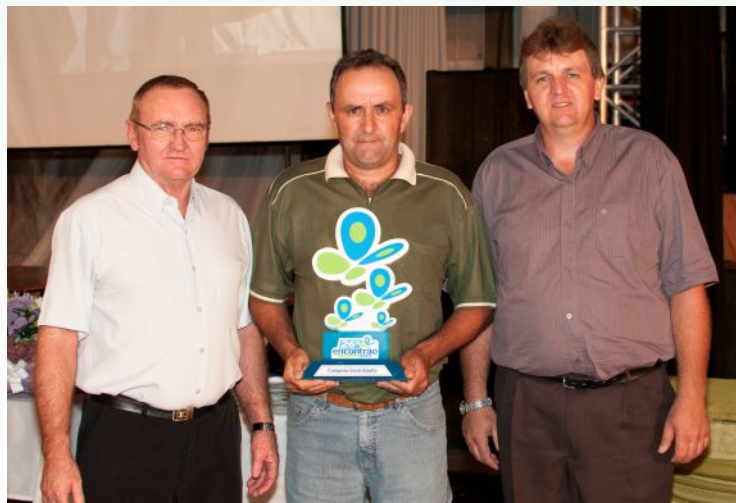
1º lugar – Núcleo Nova Geração – linha Santa Apolônia, Pejuçara