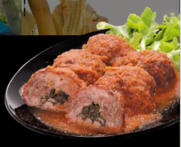
Receita: Almôndegas recheadas