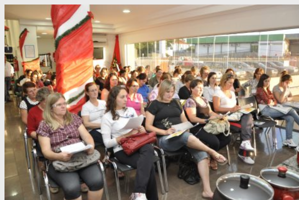
Data: 23 de novembro – Local: Supermercado Condor