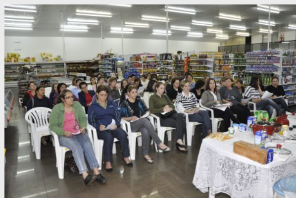
Data: 21 de novembro – Local: Supermercado Pejuçara