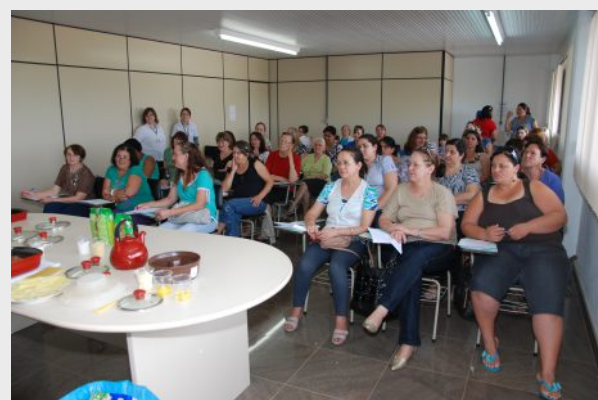
Data: 24 de novembro Local: Auditório do Supermercado Santa Bárbara do Sul