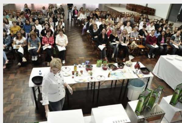
Data: 22 de novembro – Local: Afucopal